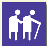
Personne à mobilité réduite

Leur offre de service devra être accessible aux personnes ayant divers types d'handicaps qui peuvent être :