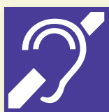
Personne ayant une déficience auditive